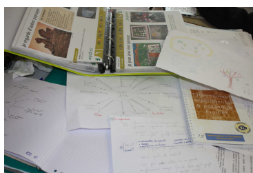
Module Étude du milieu

Une future édition ICEM qui questionnera l'étude du milieu au regard de la méthode naturelle et de la pédagogie Freinet.